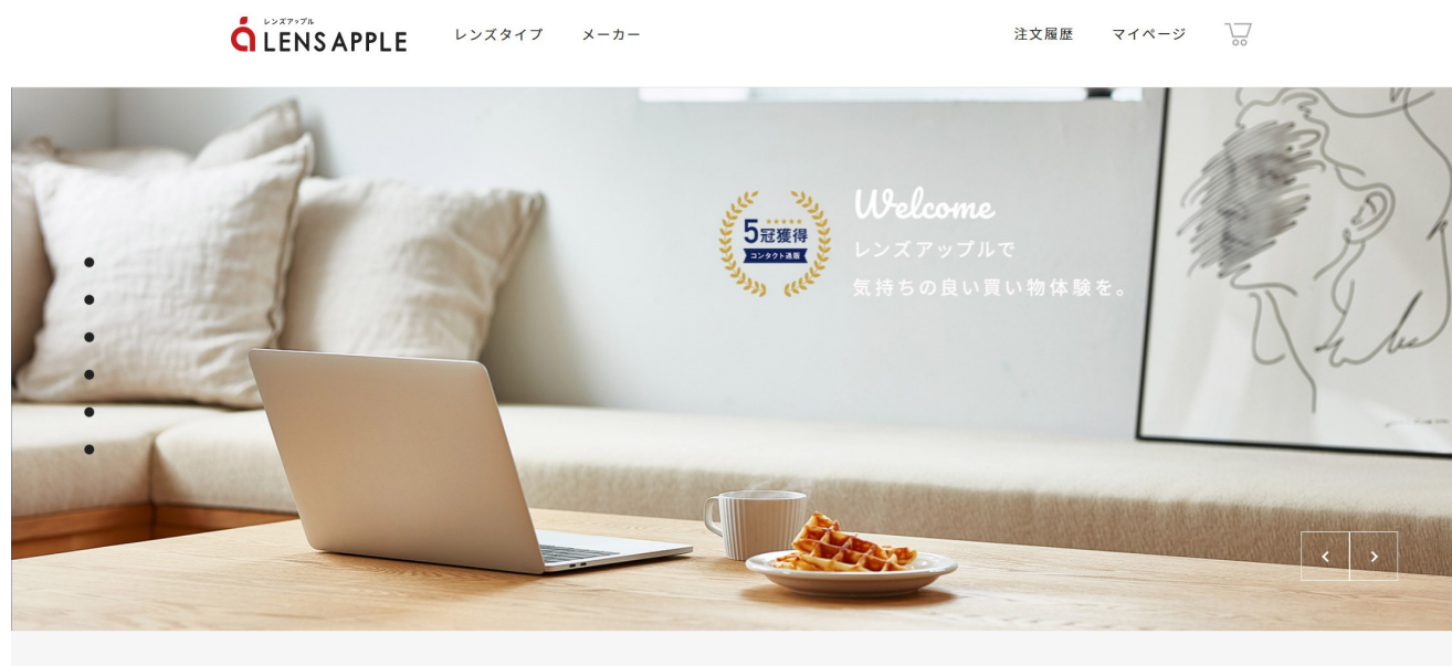
<リニューアル後の「レンズアップル」サイト TOP ページ>

「レンズアップル」では、2020年12月実施のコンタクトレンズ通販のネット調査で、お客様の満足度に繋がる5項目において No.1 を獲得するなど、お客様の快適さ・安心に繋がるサービスを追求してまいりました。今回のサイトリニューアルでは、お客様に「気持ちの良い買い物体験を」というコンセプトのもと、コロナ禍においてご自宅から安心してコンタクトレンズを購入いただけるよう、より見やすく・使いやすいサイトづくりを目指しました。